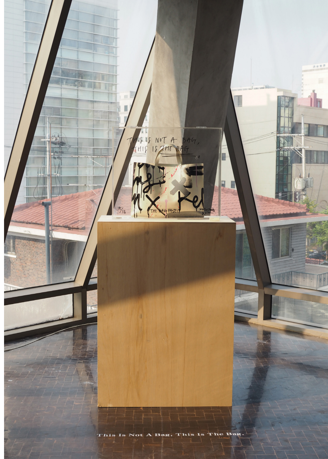
This Is Not A Bag, This Is The Bag.